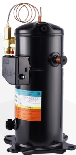
Компрессор с DTC-вентилем